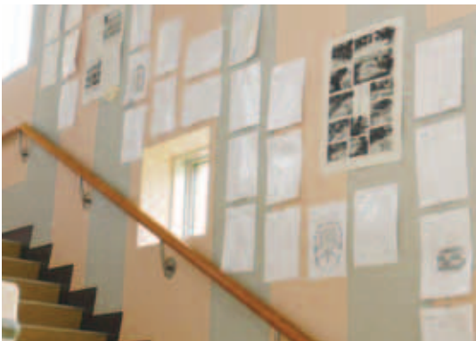
図2 制作風景のポスターも貼る