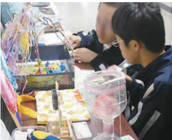
図18 共有スペースでの小学生作品の鑑賞