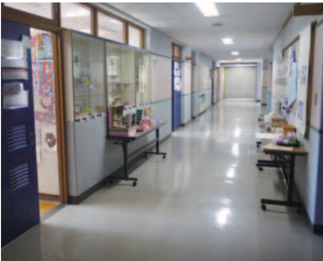
図17 美術室前の廊下の展示