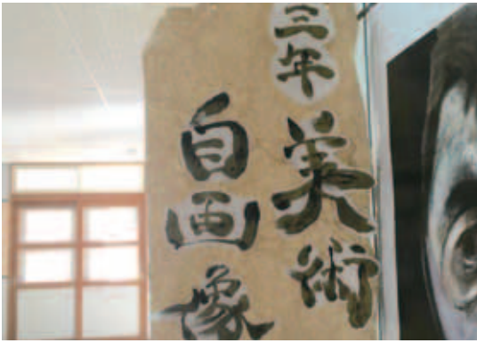
図8 廊下の展示（自画像）