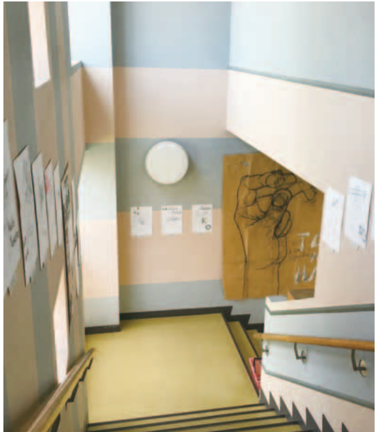
図3 階段の壁面の展示（デッサン）