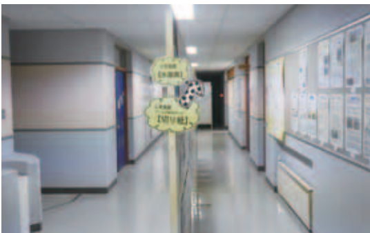
図11 廊下にパネルを立てての展示