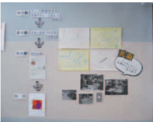
図6 制作過程も展示によって説明する