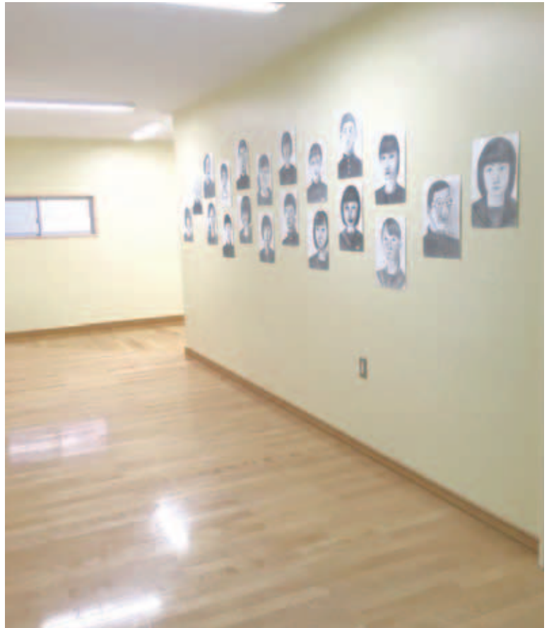
図10 廊下に展示された自画像