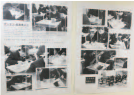
図9 自画像の制作風景ポスター