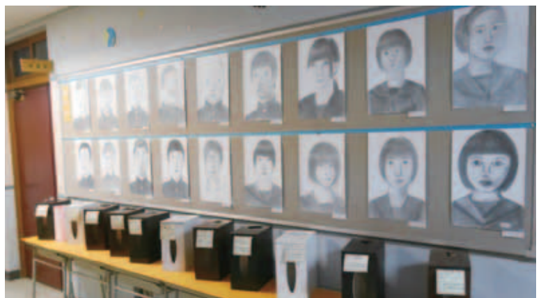
図14 学校祭での再展示