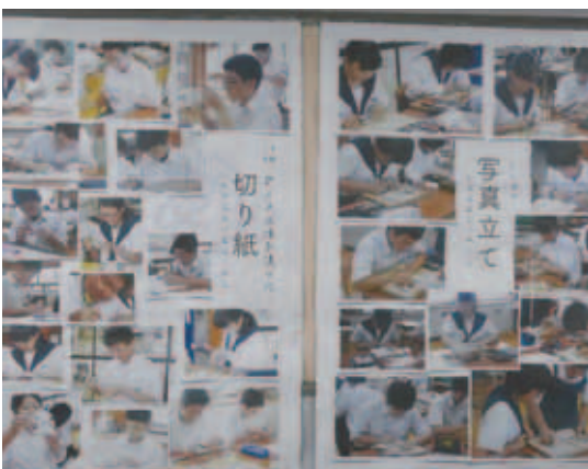
図13 各題材の制作風景ポスター