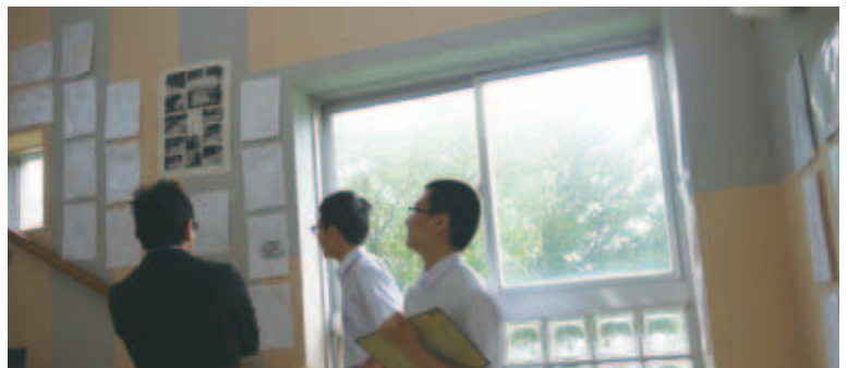
図5 展示作品の鑑賞活動