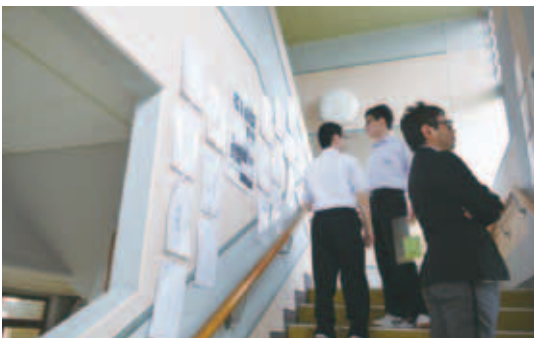
図4 展示作品の鑑賞活動