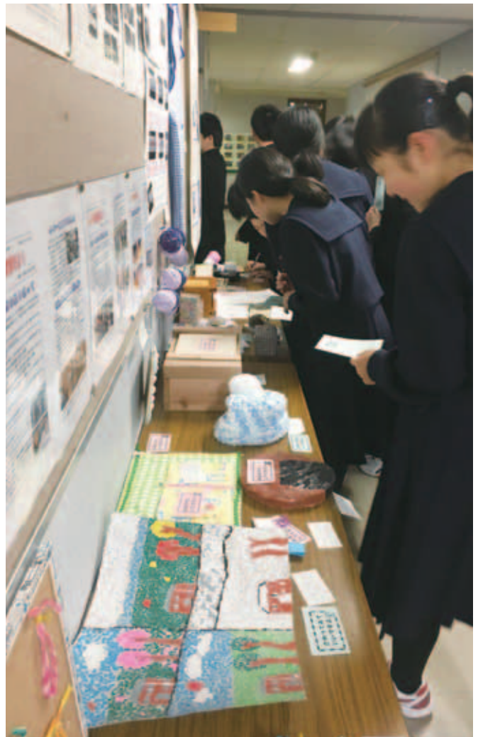
図19 共有スペースでの小学生作品の鑑賞