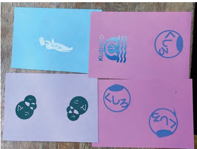
図19 江差北中の生徒が刷った附属釧路のデザイン

シルクスクリーンの版下用ポジ作成に対するICT利用は、主にタブレット端末を使った描画である。版下用ポジ作成におけるタブレット端末の利用については生徒に選択させたが、それぞれ以下のような反応があった。