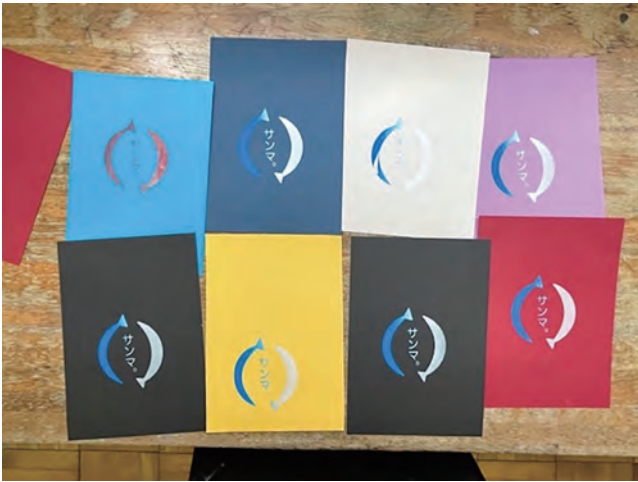
図18 江差北中の生徒が刷った附属釧路のデザイン