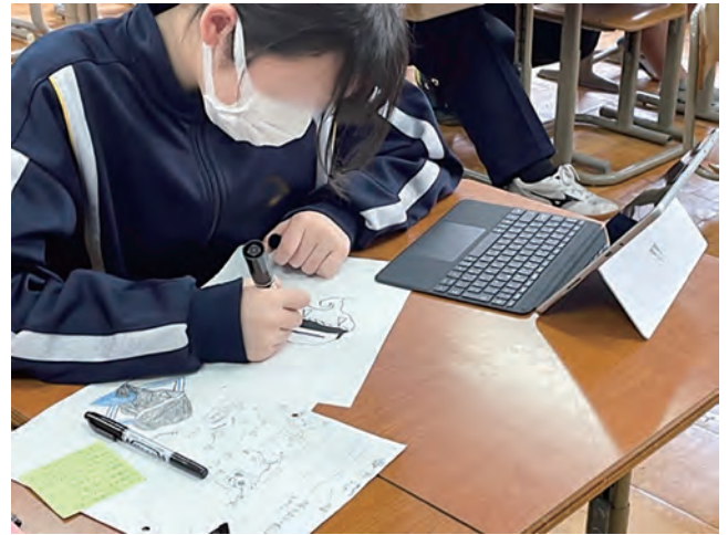
図7 タブレットを併用した版下用ポジ作成

また、いずれの方法においても、その後の製版に適した線の太さや図柄の大きさとなるように注意することを指導した。露光、水洗の製版工程は手際よく進めることができた。