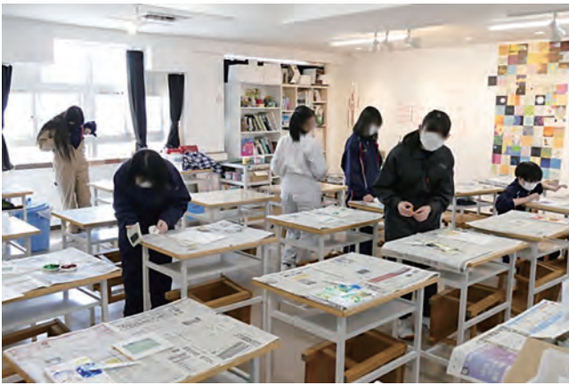
図14 附属釧路の美術部生徒による刷り

さを知ることができる。釧路と江差という港町同士であったので、共通した特徴やモチーフをデザインにする発想の広がりや、視点の豊かさを感じさせることができた。