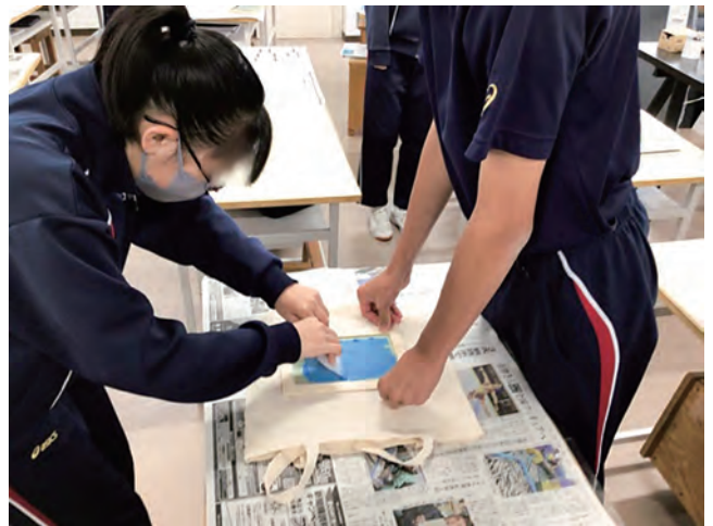
図13 附属釧路でのエコバッグ制作の実践

シルクスクリーンは、布を始めさまざまな素材に印刷できることを特徴とする技法だが、印刷の特徴は複数作成できることである。したがって、シルクスクリーンによる1点制作は、その特徴の半分しか生かしていないことになる。