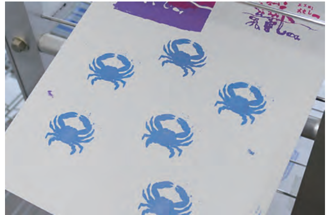
図17 紙製書類フォルダーに刷った作品