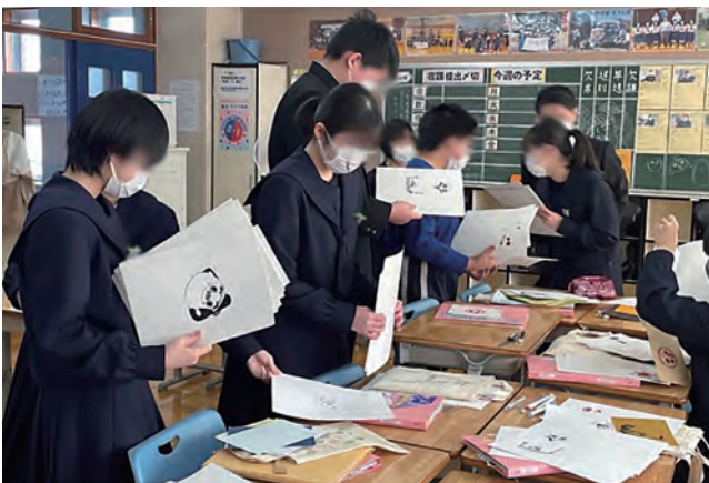
図20 江差北中での作品交換会

生徒の学習活動のためだけでなく、へき地の教員が新しい題材に取り組んだり、指導上の困難を抱えたりした時のサポートや相互交流のシステム構築にICT機器や設備を活用することも視野に入れる必要があるだろう。