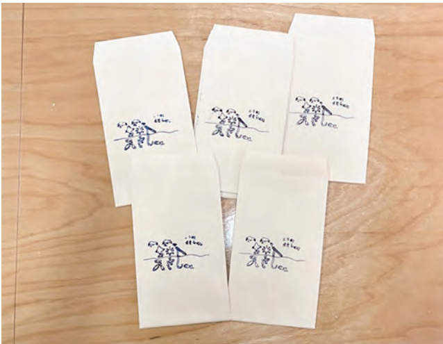
図11 封筒に刷った作品

紙製の書類フォルダー、封筒、ハガキ大程度の色画用紙を潤沢に準備し、生徒が刷りを繰り返し体験できるようにした。インクはチューブ入りのアクリル絵の具やポスターカラーを使った。刷りの回数を重ねることによって、刷りの工夫をしたり、バリエーションを楽しんだりする生徒の姿が見られた。