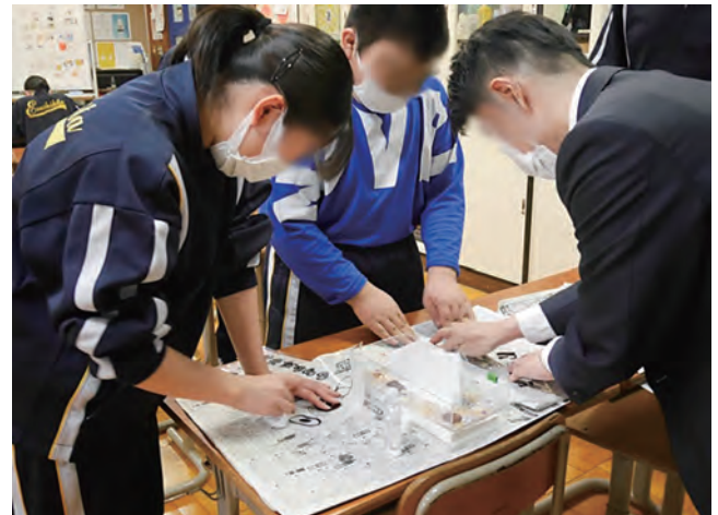
図3 試作段階での版下用ポジ制作

第1段階の試作では、生徒は自分の氏名をモチーフにデザインし、さまざまな太さの線、面や点を組み合わせた原画を作成した。描いた原画の点・線・面が印刷物に転換される孔版特有の表現を体感させたいと考えたからである。試作を通した手順の理解とノウハウの定着のために、パールフィルムや印刷用の紙などの材料、時間を十分に確保して指導を行った。生徒にとっては初めての体験なので、鮮明な描線が得られない、インクが垂れる、版が途中で壊れるなどの失敗も見られた。制作後に試作を展示鑑賞し、それぞれの表現の良さや工夫、失敗の原因、課題と対策について交流した。