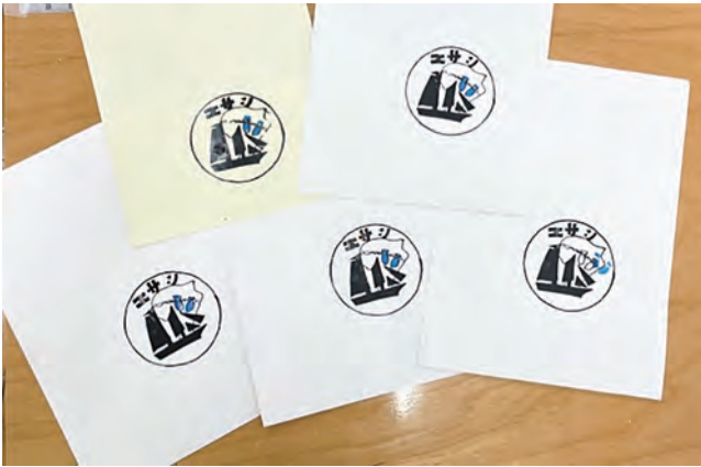
図10 紙製フォルダーに刷った作品

紙製の書類フォルダー、封筒、ハガキ大程度の色画用紙を潤沢に準備し、生徒が刷りを繰り返し体験できるようにした。インクはチューブ入りのアクリル絵の具やポスターカラーを使った。刷りの回数を重ねることによって、刷りの工夫をしたり、バリエーションを楽しんだりする生徒の姿が見られた。