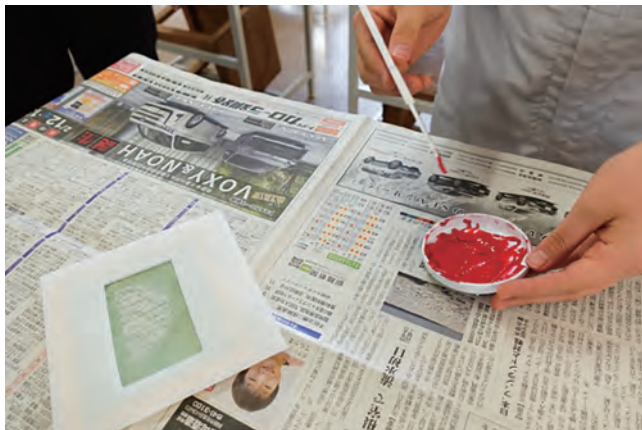
図15 プラスチック枠に張ったスクリーン