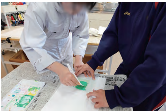
図16 版のサイズにあったスキージ（ヘラ）で刷る