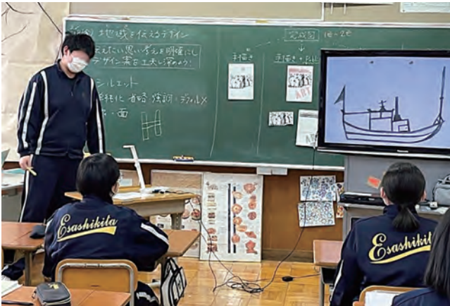
図5 デザインの交流

「限られた色数で表すにはどうするか」「こんなに単純な形でいいのか」「モチーフから何を抽出するか」「誰に何を伝えるのか」といった疑問が生徒から生じた。そこで、附属釧路から送られてきたデザインのデータを提示し交流を行った。直接対話ではなかったが、生徒は「シンボルマーク」の特徴とシルクスクリーンを生かす工夫を感じ取り、形の強調・省略、線や面の組み合わせや構成の仕方を自身の作品に生かすことができた。江差と釧路が港町であるという共通点に着目し、両者に共通するモチーフをデザインする生徒も見られた。