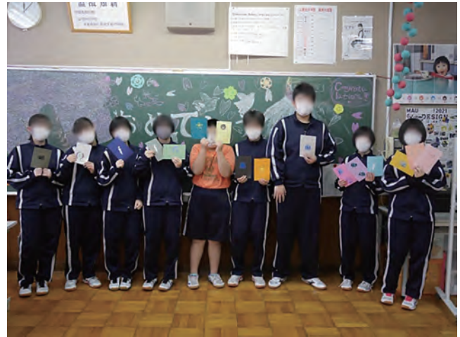
図21 附属釧路デザインの刷り上がりをもつ江差北中生徒

こうした点からシルクスクリーン印刷はICT機器を併用しながら行う学習に向いているといえる。生徒のデザインが実用物として実現する学習でもあるから、シルクスクリーンは美術を生活や社会とつなぐ可能性をもっている。しかし、工程が複雑で多くの材料・用具を用いるため、これらを簡素化・簡略化する教材研究もまた必要である。