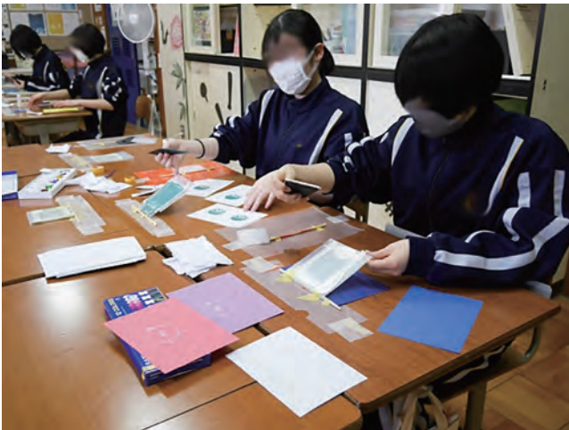
図12 附属釧路のデザインを刷る江差北中の生徒