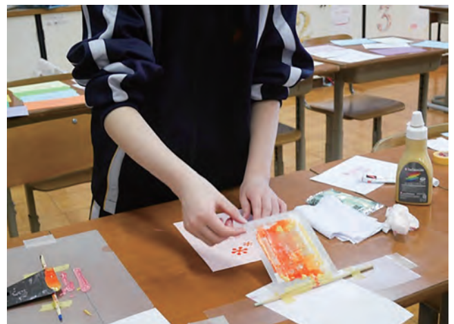
図9 枠を机に固定して刷る