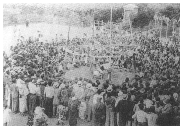
資料4 女相撲の様子