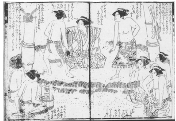
資料1 「鎌倉山女相撲濫觴」天明5（1785）年

資料1は江戸時代の女相撲の様子であり、黄表紙に出てくるものである。資料2は勝川春章が描いた江戸時代の勧進相撲の様子である。2枚の絵の様子は酷似しており、4つの共通点が見られる。まず第1は力士の様子であり、裸体にまわし姿で