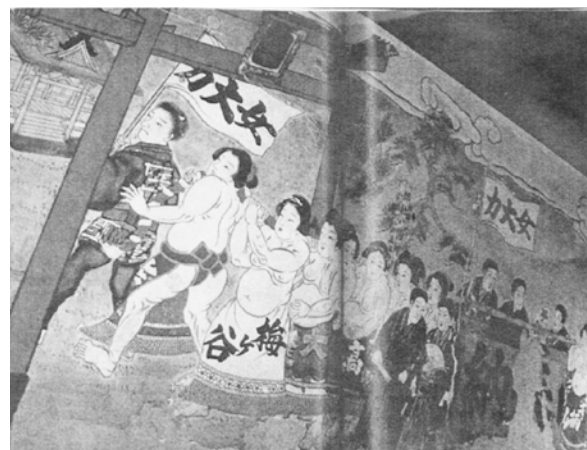
資料3 女相撲の絵馬

この2枚の写真は、それぞれ明治22年（1889年）と昭和11年（1936年）のものであり、その間には47年の開きがある。47年間で決定的に変わったのは何か。それは着衣の有無（まわしを除く）である。着衣無し的女力士の様子が描かれた絵馬が奉納された翌年の明治23年に、警視庁による興行停止命令があった。しばらく下がって大正15年（1926